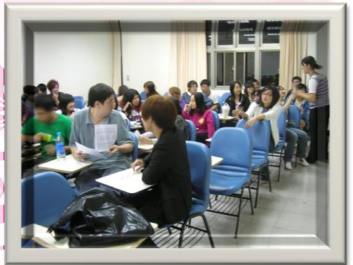
英日研社上課情形