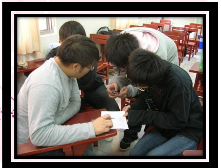
英日廣角上課情形